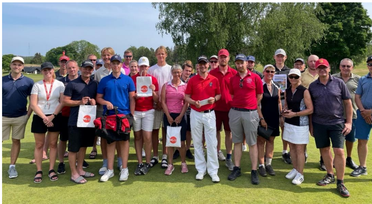
På bilden ovan är pristagarna i årets upplaga av Viking Line Open. Viking Line Open vanns av Dubbeltvillingarna följt av Four Swingers och på tredje plats kom The Open Champions. Totalt detlog 28 lag i tävlingen.